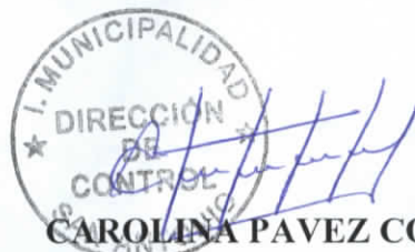
CAROLINA PAVEZ CORNEJO DIRECTORA DE CONTROL